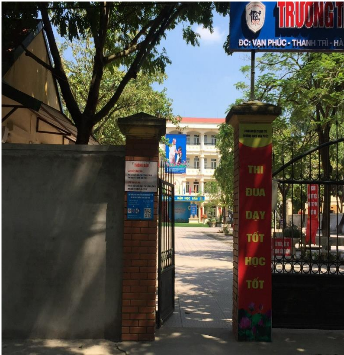
Cổng trường được sửa lại có gắn mã QR y tế để quét khi đến trường