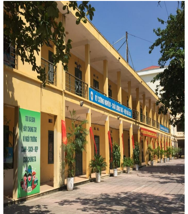
Sân trường trang trí thêm nhiều cây xanh và bảng khẩu hiệu