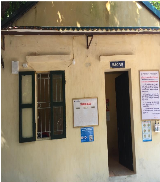
Phòng bảo vệ gắn loa thông báo và có đầy đủ các dụng dịch sát khuẩn, mã QR y tế